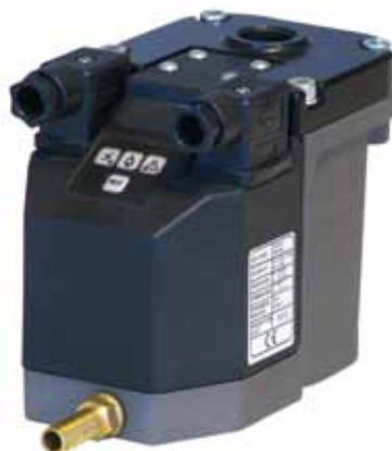
Reihe N-HP niveaugeregelt – Hochdruck

Niveaugeregelte und zeitgesteuerte Kondensatableiter · Hochdruck