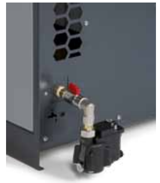
mit montiertem KONDRAIN® N1