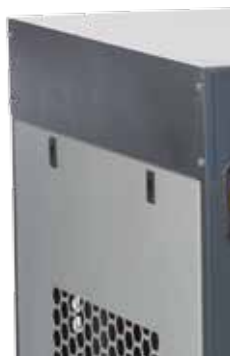
praktischer Clip-Verschluss an den Seitenteilen