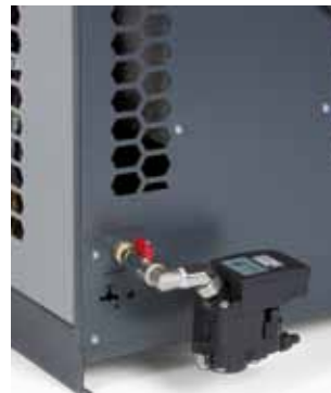
mit montiertem KONDRAIN® N5