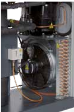
einfacher Zugang zum klar strukturierten Inneren