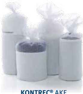
Aktivkohlefilter für Öl-Wasser-Trenner