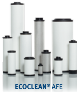
Filterelemente und Kartuschen für Druckluftfilter