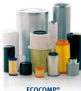
Filter für Kompressoren und Vakuumpumpen