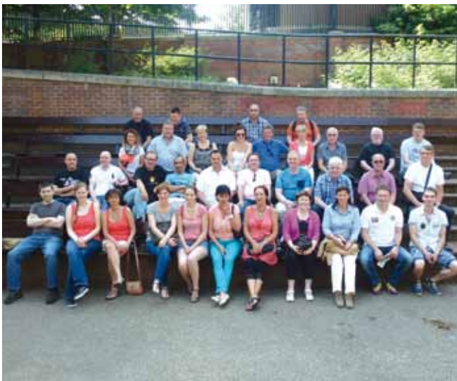
Mitarbeiter der KSI Deutschland in England

Seit 2013 ist Worcestershire in den britischen Midlands bei den KSI Mitarbeitern nicht mehr nur als Herkunftsort der beliebten und vielfach falsch ausgesprochenen Worcestersauce (spricht: Wuster-Soße) und als Heimat des Led Zeppelin Schlagzeugers John Bonham bekannt. Denn unser letztjähriges Sommerfest haben wir kurzer Hand an den Standort der KSI Tochter KSI Technologies Ltd. verlegt und fast die gesamte Belegschaft dorthin gebracht. Nicht wegen des berühmt berüchtigt schönen britischen Sommers, sondern weil gemeinsame Aktivitäten aller Mitarbeiter ein wichtiger Bestandteil der KSI Unternehmenskultur sind. Nur so werden aus anonymen Email-Adressen echte Kollegen. So haben wir kurzer Hand die Belegschaft nach Norwich verfrachtet, richtiger: nach Cromer, der britischen Produktionsstätte der Filterelemente. Vor Ort durften dann freiwillige Mitarbeiter sich nicht nur ansehen, wie Filterelemente für Druckluftfilter gefertigt werden, sondern auch selbst Hand anlegen – ein lehrreicher Prozess. Die anschließende Party auf dem Firmengelände war dann ein voller Erfolg, über den aber nur hinter verschlossenen Türen berichtet wird. Cheers.