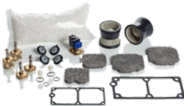
Wartungsteile für Fremdtrockner