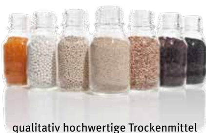
qualitativ hochwertige Trockenmittel

Für den Fachhandel ist das immer wiederkehrende Service- und Wartungsgeschäft eine wichtige kalkulatorische Größe. Die KSI unterstützt als „Alles aus einer Hand“-Anbieter diese Säule des Fachhandelsgeschäfts mit passenden, qualitativ hochwertigen Austauschkomponenten für Fremdhersteller.