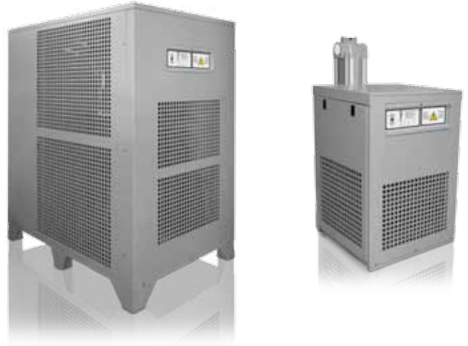
Rechts: Reihe bis 660 m 3 /h mit außenliegendem Wärmetauscher für eine noch kompaktere Bauweise und optimaler Anschlussmöglichkeit Links: Reihe von 780 m 3 /h bis 8.400 m 3 /h

Die neue Reihe ist ab sofort bestellbar.