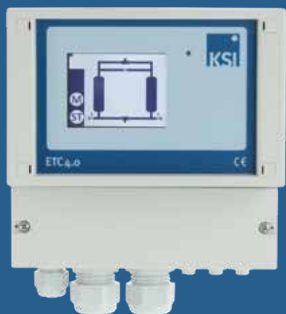
ETC 4.0 & KSI ECOCONTROL