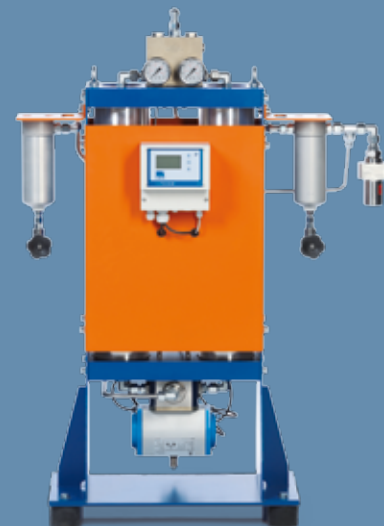
ECOTROC® ATKN-HP bis 500 bar