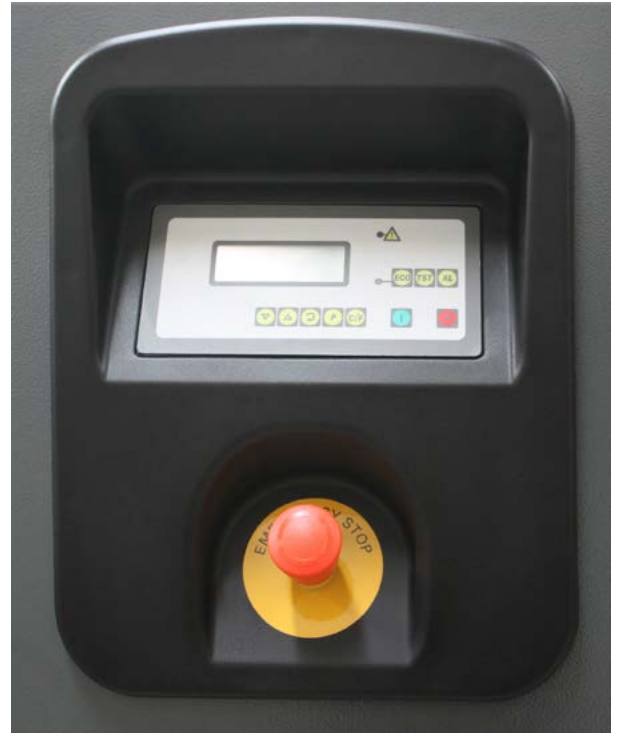
(Beispiel: Ab KTD-BN 1380 ESD3 Steuerung optional)