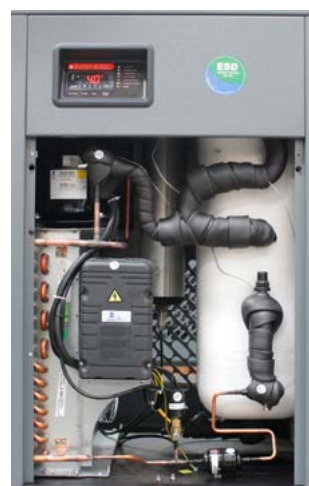
einfacher Zugang zum klar strukturierten Inneren