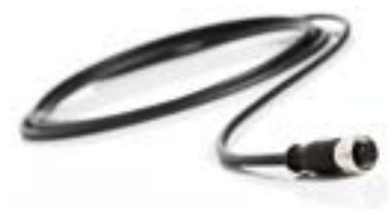
Kabel für potentialfreien Alarmkontakt